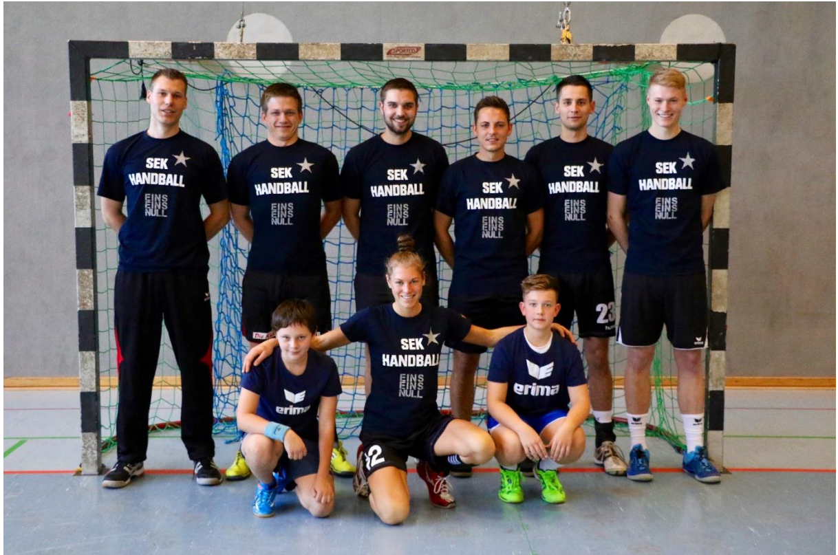
Das Studententeam Sharing is Caring gewann die diesjährige Auflage des Connex-Cups!